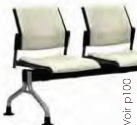
Voir p 100