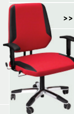
>> MaXX L