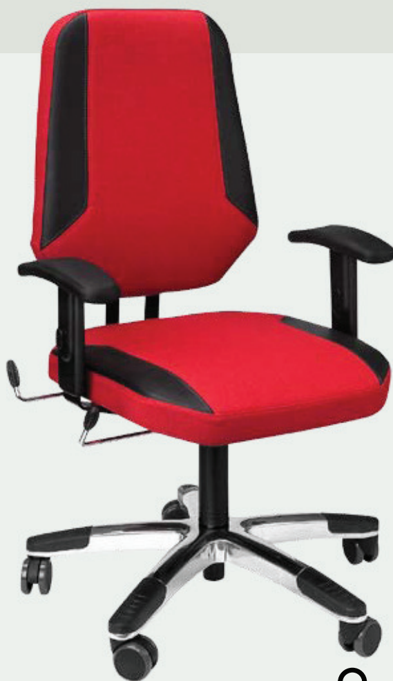
>> MaXX S