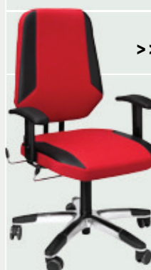
>> MaXX M