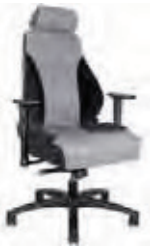
TECH24 - TE1147