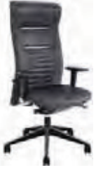
Ligne Club 3x8 - LC514B