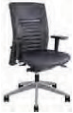
Ligne Club 3x8 - LC513B