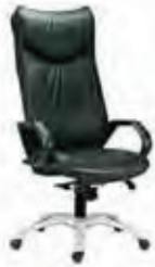
Gräffic - GA0EVO