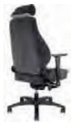
TECH24 - TE1147